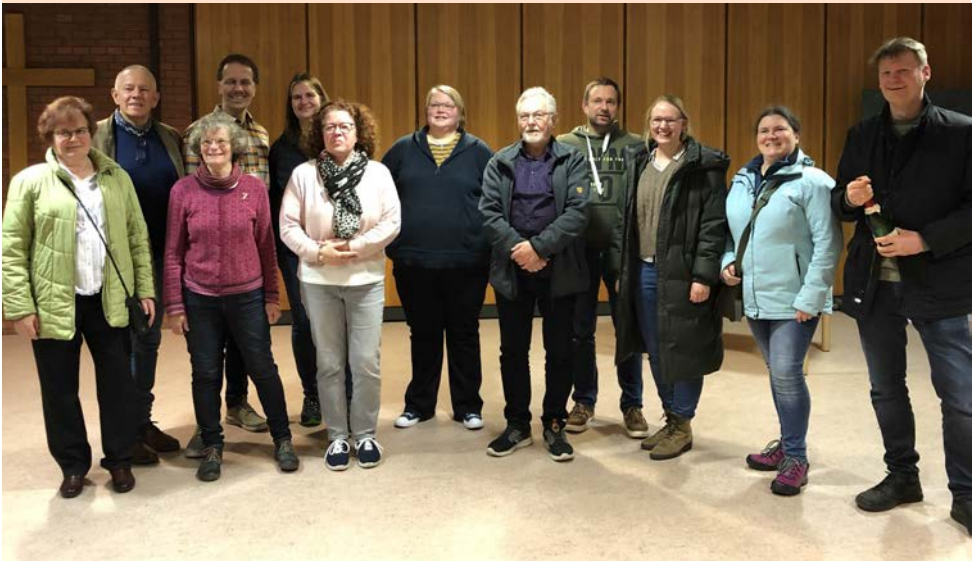
Foto oben: Der Wahlvorstand. Foto unten: Am Wahlabend, Sonntag, 10. März 2024