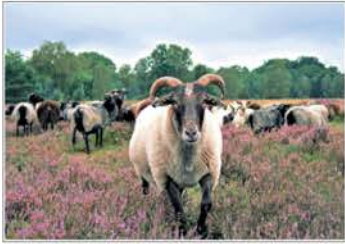
BILDER AUS DER LÜNEBURGER HEIDE